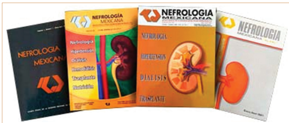
Figura 1. Evolución de Nefrología Mexicana .